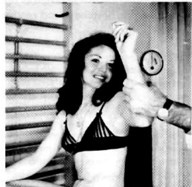
Skulderled: Indre og ydre rotation