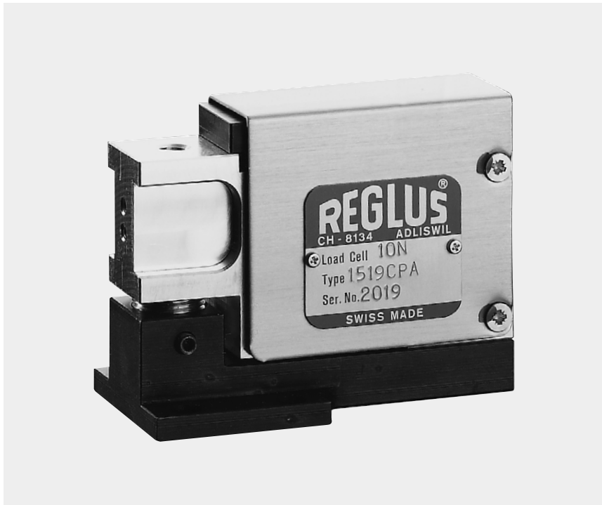
REGLUS Zug/Druck-Kraftaufnehmer Typ 1519CPA, Nennbereich 10 N (~1kg), bis zum 100-fachen Nennwert geschützt vor Überlastung

für Zug-, Druckkraftmessungen und Wägelösungen mit hohen Anforderungen